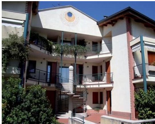
1° esempio di bioedilizia italiana (Caponago, MI)